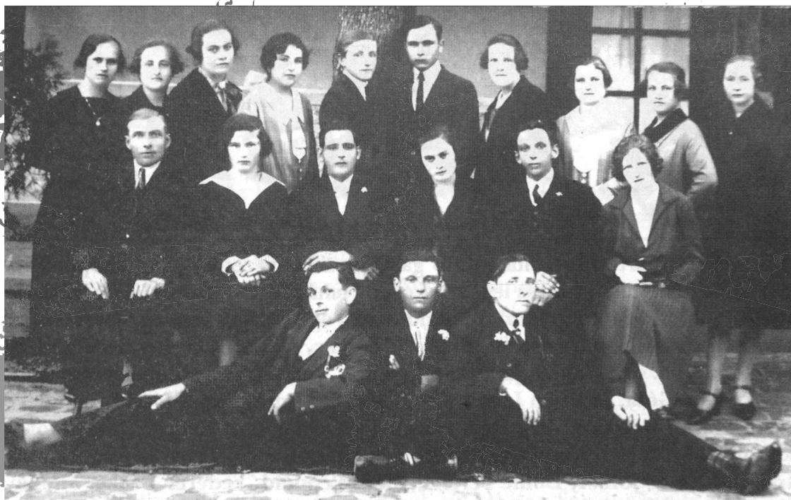
Gyermekelőadás az Amerikában (1928 vagy 1929)