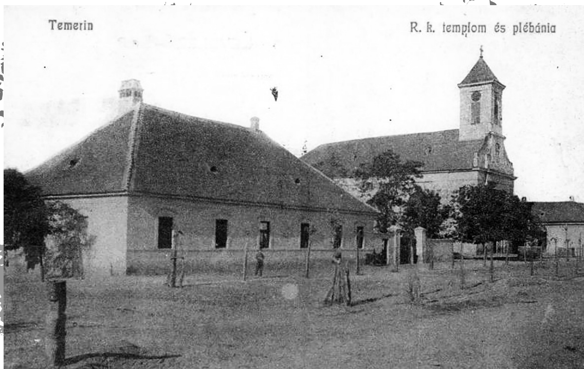
A templom és a plébániaépület a múlt század elején