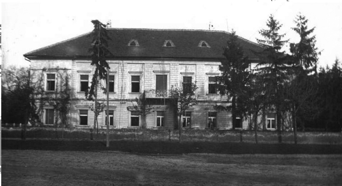
A Szécsen-kastély a múlt század húszas éveiben