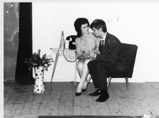
A Tavasz keringőt 1967-ben mutatták be