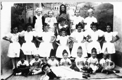
Hőféherke és a hét törpe szereplői