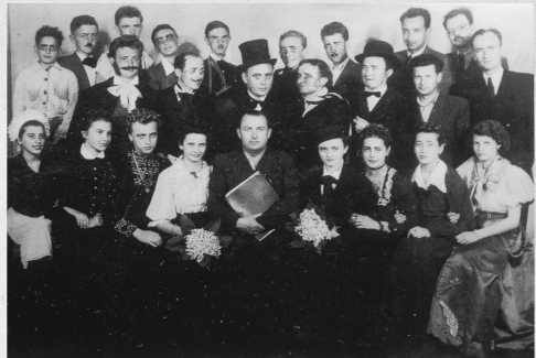
Copperfield Dávid szereplői