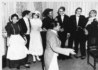
A Három kalap című vígjáték 1967-es felejthetetlen pillanatai