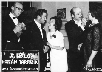
A hölgy hozzám tartozik – Mindent a nőkért: két elsöprő előadás a 60-as évek végéről és a 70-es évek elejéről