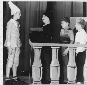
1972-ben a Pinocchio óriási sikert aratott